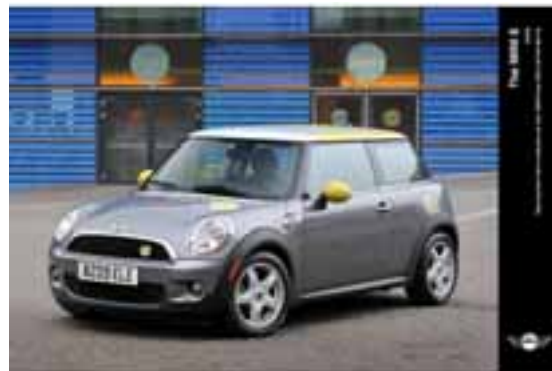
Mini-E de BMW

Con la colaboración de BMW y la compañía energética E.ON, se viene desarrollando desde julio del 2009 un proyecto piloto en Múnich, consistente en la incorporación al parque móvil municipal de 15 vehículos Mini E. La infraestructura de recarga necesaria, accesible al público y para todos los vehículos eléctricos convencionales, fue instalada por E.ON, y la energía necesaria para el funcionamiento de los coches eléctricos procede de centrales hidroeléctricas. El objetivo de este proyecto piloto es evaluar cuál es la demanda de estaciones de recarga y el uso de estos vehículos.