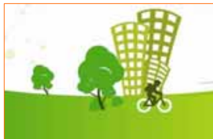
Programa EXOIKONOMO en municipios griegos

Se prevé que diversos municipios pongan en marcha actuaciones que incluyan la compra e instalación de productos asociados.