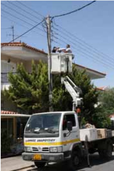
Sustitución de sistemas de alumbrado antiguos en Amaroussion

Además, la compra a gran escala (2.500 luminarias) dio lugar a una reducción del precio en el mercado de hasta un 46% .